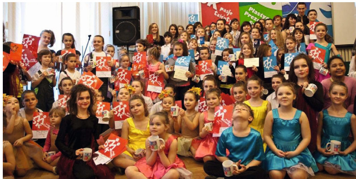
● Młodzieżowy Dom Kultury co roku rozszerza swoją ofertę dla dzieci i młodzieży. W tym roku jest aż 101 grup.