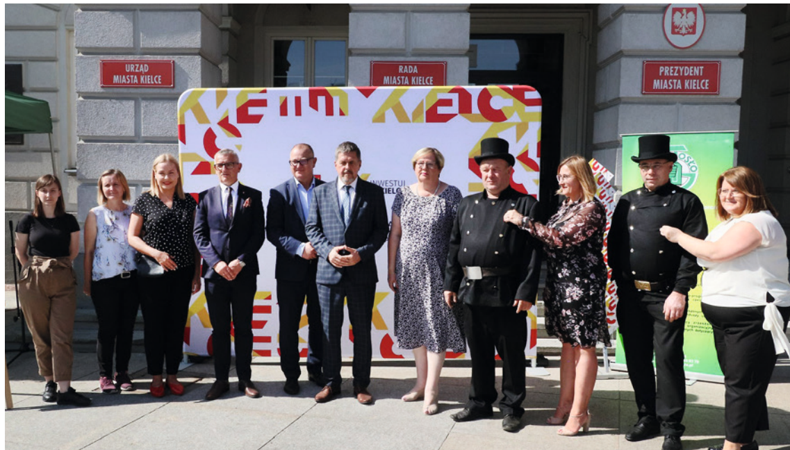
● Kielecka Mapa Rzemieślników została oficjalnie zaprezentowana podczas Rzemieślniczego Bazaru, który się odbył 11 września na Rynku. Wzięło w nim udział wielu gości.

Celem projektu jest promocja usług zakładów rzemieślniczych z terenu Miasta Kielce w lokalnych mediach, internecie, broszurach oraz popularyzacja interaktywnej mapy kieleckich zakładów rzemieślniczych. W chwili obecnej na stronie Idea Kielce mieszkańcy znajdują listę i adresy do 39 fachowców z naszego miasta, którzy już zgłosili się do udziału w bezpłatnym projekcie. Kielecka Mapa Rzemieślników cały czas jest otwarta i będzie się rozrastać. Ma służyć pomocą każdemu, kto