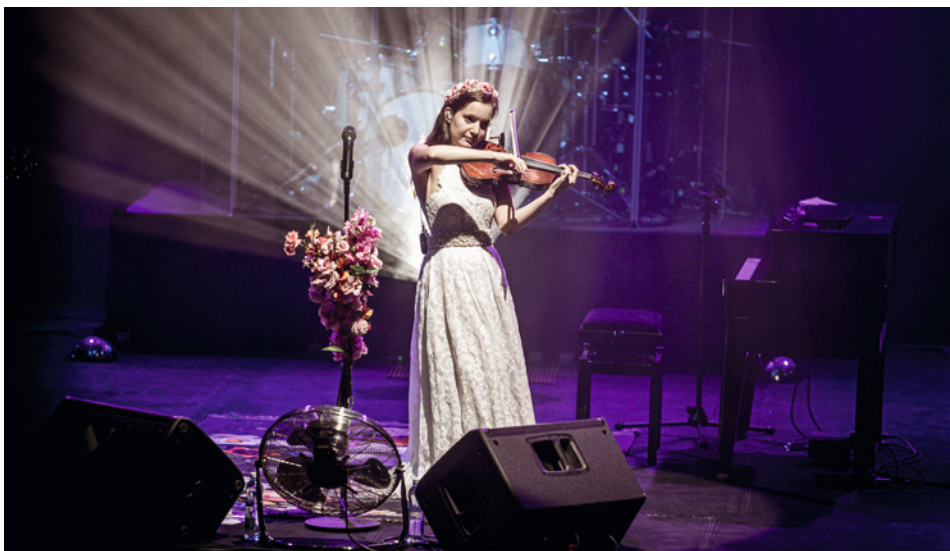
● „Królowa dram” nie zawiodła. Były największe hity i piosenki z nowej płyty „Irenka”. Najpopularniejsza obecnie wokalistka Sanah wystąpiła w Kieleckim Centrum Kultury.