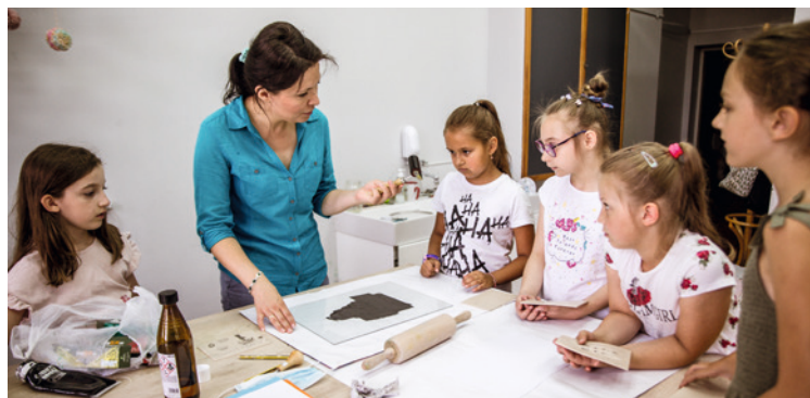
● Podczas zajęć Małej Akademii Sztuk Pięknych KCK.