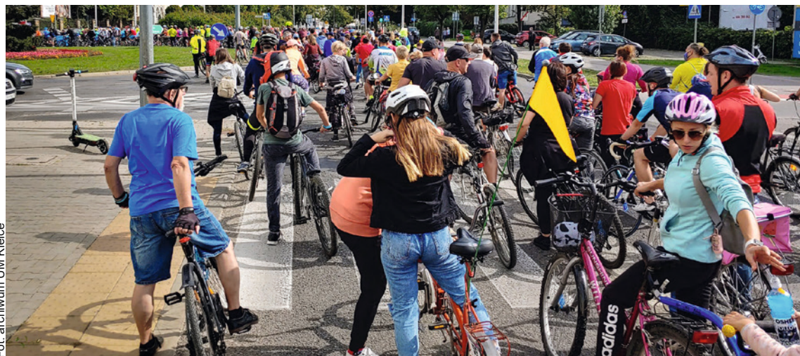
● Kieleckie Święto Rowerzysty w ubiegłym roku cieszyło się dużym powodzeniem.

Dzień później, w niedzielę, odbędzie się Kieleckie Święto Rowerzysty, które rozpocznie się o godzinie 12 na Rynku od przejazdu wielkim i głośnym