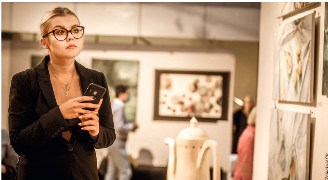
● Prace absolwentów naszego „Plastyka” można oglądać w Galerii „Winda” w Kieleckim Centrum Kultury.

Złoczone, piękne zdobione szkatułki i zestawy toaletowe – te tradycyjne i bardziej nowoczesne, z pokrywkami w formie kolorowych, inspirowanych hiszpańską mozaiką – aż kuszą, by umieścić je pod lustrem toaletki. A poduszki z artystycznymi nadrukami namawiają do odpoczynku.