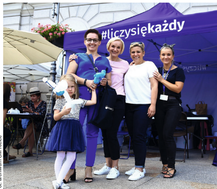
● Uczestnicy akcji „Lato ze spisem w Kielcach” na Rynku.