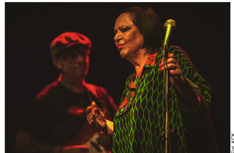
● Nowe głośniki zamontowane na Dużej Scenie KCK po raz pierwszy zabrzmiały na koncercie Grażyny Łobaszewskiej.