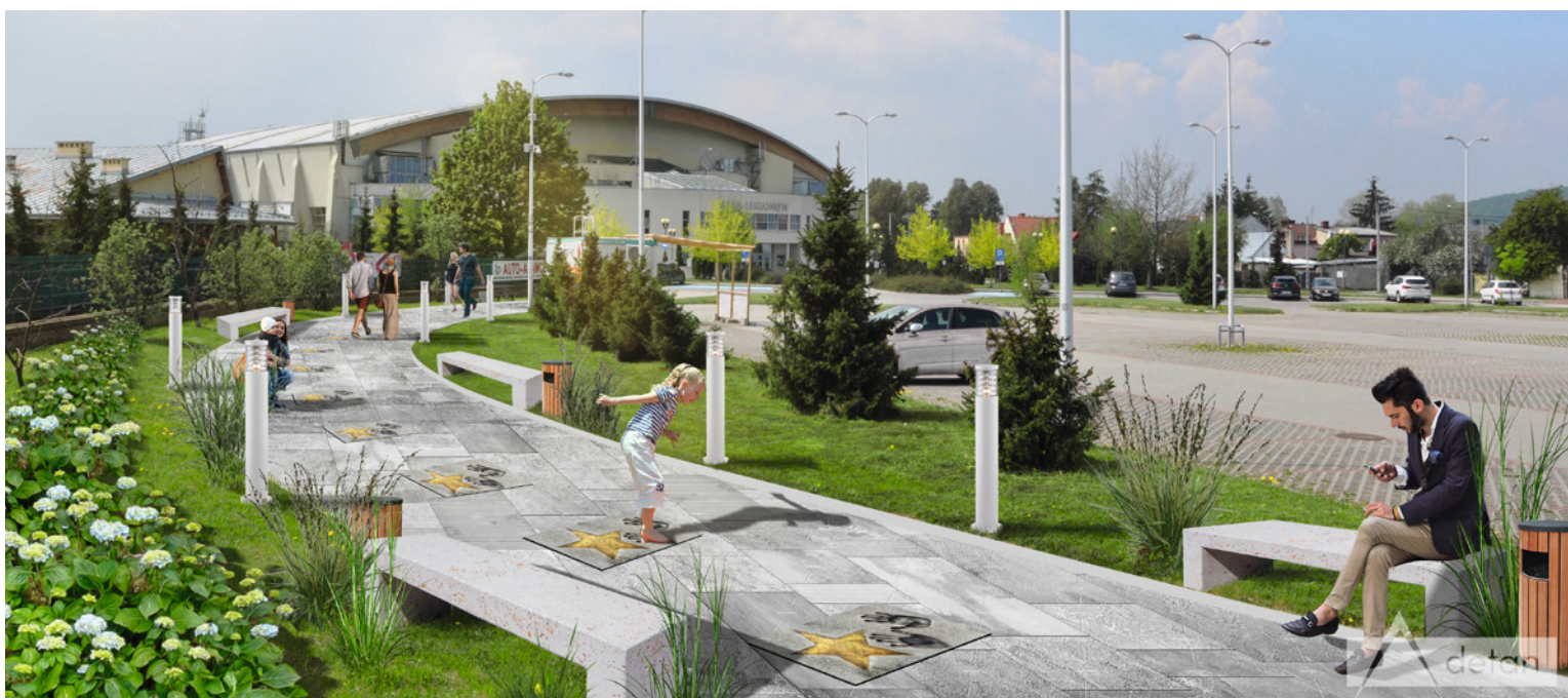
● Aleja Sław Piłki Ręcznej przy Hali Legionów to tylko jeden z wielu projektów, na które mieszkańcy Kielc już niebawem będą mogli oddawać swoje głosy.

2. Urząd Miasta Kielce, ul. Strycharska 6, Biuro Obsługi Interesanta od poniedziałku do piątku