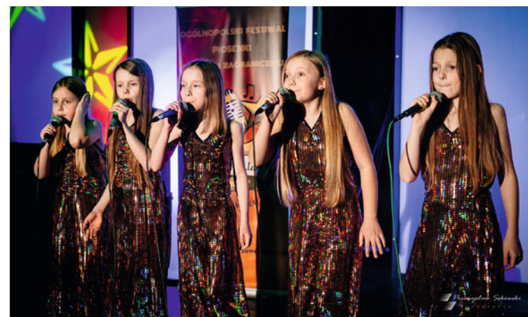
● W Młodzieżowym Domu Kultury działa aż w pięć Studiów Piosenki.

W Młodzieżowym Domu Kultury ćwiczy wielu przyszłych piosenkarzy i piosenkarek, a zajęcia prowadzone są równoległe w pięciu Studiach Piosenki. Uczestnicy często startują w wielu popularnych programach telewizyjnych np. „The Voice of Poland”, „The Voice of Kids”, „Szansa na sukces”. Przez kilkanaście lat działania pracowni w zajęciach brało